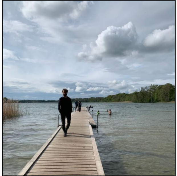
Badning (for de modigste) ved Buresø