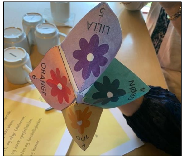
En såkaldt "flip/flopper"