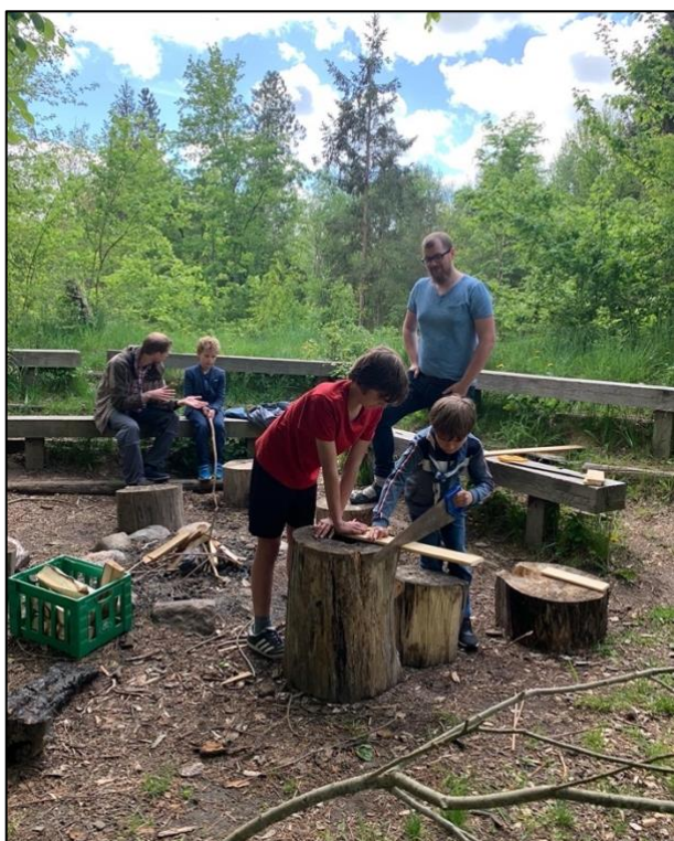
Der bygges insekthoteller