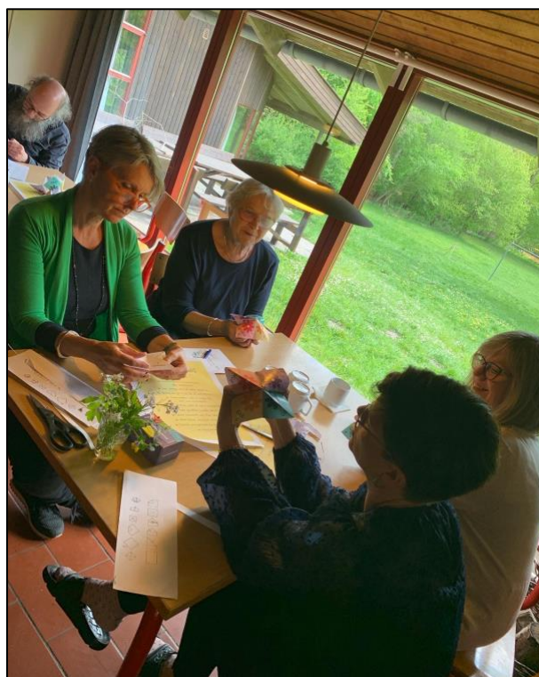
... og samtalt ud fra dialogkort