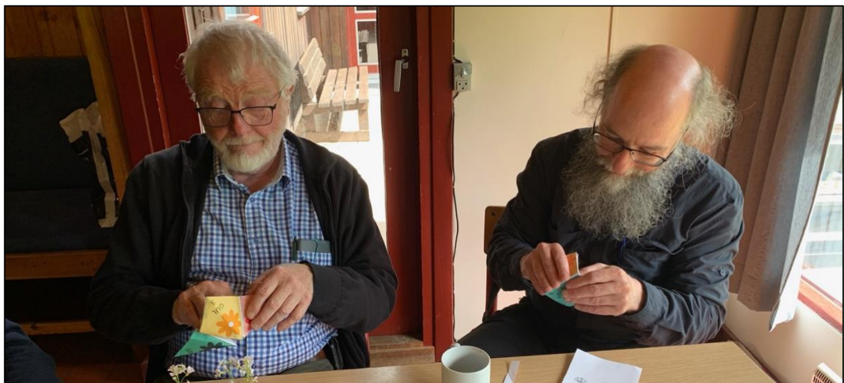
Dyb, dyb papirfoldningskoncentration...