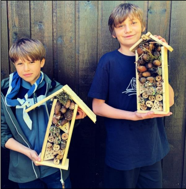
Færdige insekthoteller – klar til indflytning!