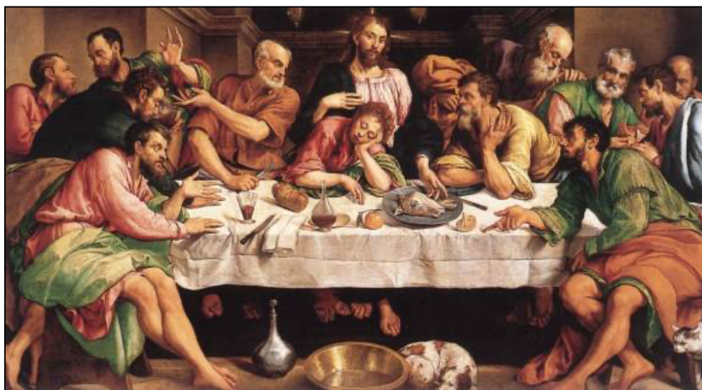
Jesus til middag hos en ledende farisæer på en sabbat

Lukas 14, 1-11 Engang på en sabbat var Jesus kommet ind for at spise hos en af de ledende farisæere, og de sad og holdt øje med ham. Da stod der foran ham en mand, som led af vand i kroppen, og Jesus spurgte de lovkyndige og farisæerne: »Er det tilladt at helbrede på sabbatten eller ej?« Men de sagde ingenting. Så rørte han ved manden og helbredte ham og lod ham gå. Derpå sagde han til dem: »Hvis en af jer har en søn eller